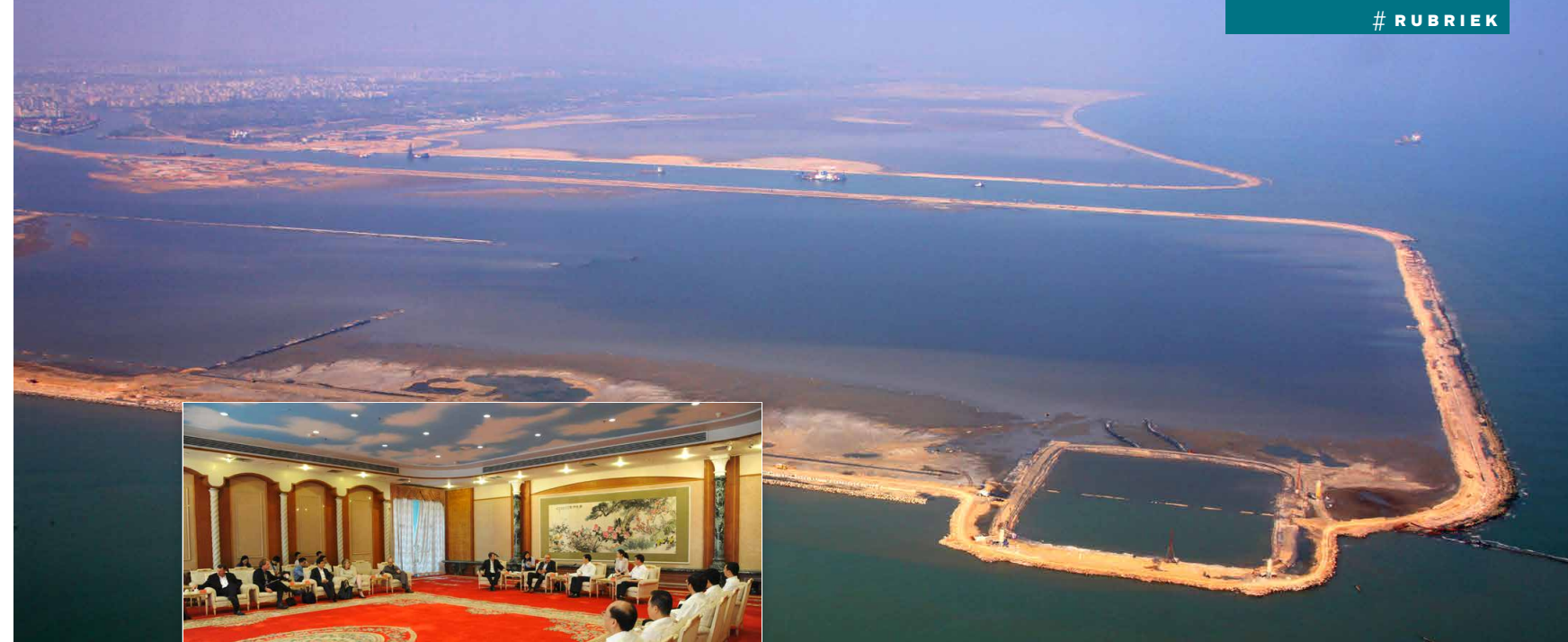
Het geplande gebied in aanleg