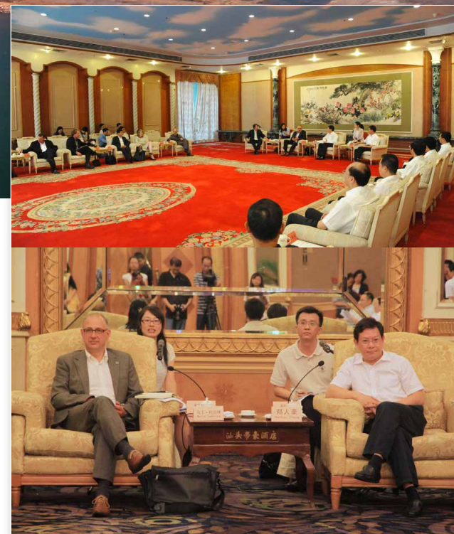
BOVEN Het formele begin van de Award Ceremony. The sky is the ceiling. ONDER Het persmoment aan de start van de prijsvraag.