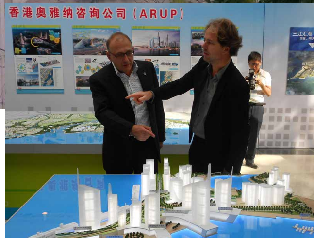
Jansen & Janssen in volle actie. 'Volgens mij knelt hier het schoentje.' 'Sterker nog, beste collega, volgens mij knelt het daar...'

Er zijn tekenen dat dit beleid vruchten begint af te werpen. Maar critici klagen dat de beste 'overheids'appartementen alleen beschikbaar zijn voor ambtenaren en dat voor het gewone volk alleen de kwalitatief mindere woningen overblijven. Daarnaast worden veel appartementen gekocht, niet om in te wonen, maar om familiekapitaal te beleggen. Het gevolg is dat er hele woonwijken zo goed als leeg staan. 'Nee, daar wonen geen mensen, daar woont ons geld', krijgen verbouwde buitenlanders vaak te horen. De steeds rijker wordende Chinese middenklasse investeert liever in vastgoed dan dat ze geld op een spaarrekening of in een pensioenpolis stopt. Banken worden in China niet vertrouwd. Men koopt liever, samen met vrienden en familie, appartementen op om deze later weer met winst te verkopen. Als het even kan een hele verdieping tegelijk en vaak ook nog met geleend geld. Appartementen op de zesde, achtste en achttiende verdieping, de Chinese lucky numbers , zijn weliswaar vaak duurder dan de rest, maar zijn wel als eerste weg. Overigens ontbreekt doorgaans de vierde verdieping. Dat getal wordt in China geassocieerd met de dood, ongeluk en verlies. Vastgoedontwikkeling, stedenbouw en architectuur zijn big business in China, heel wat grote internationale stedenbouwkun-